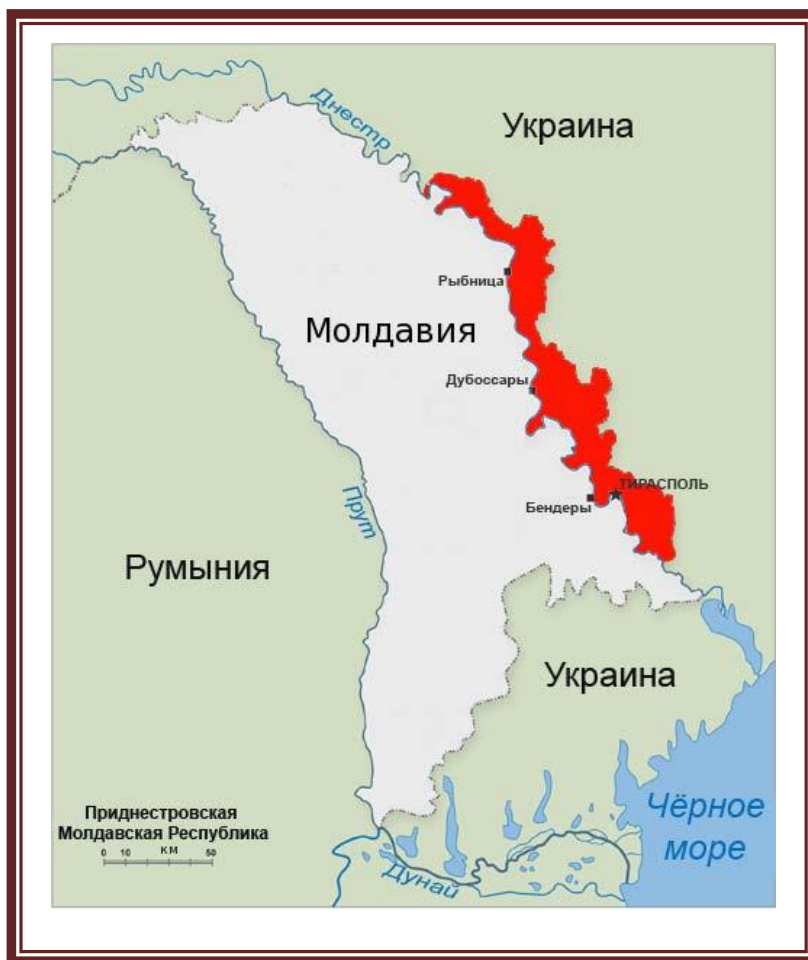
Рис. 5 Приднестровская Молдавская Республика (показана красным цветом) [14].

Республикой Молдовой и находится на территории таких её районов, как: Дубоссарский, Каушанский и Новоаненский.