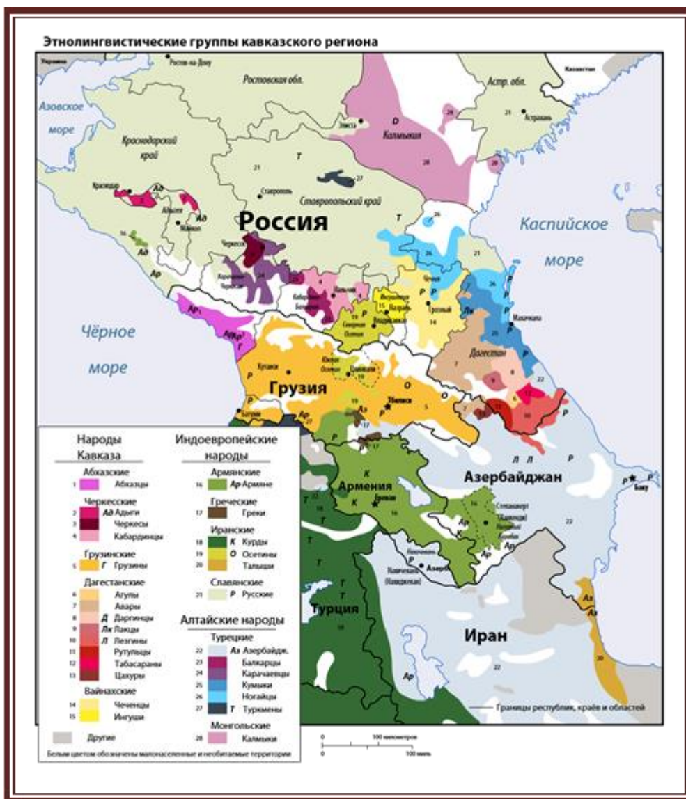
Рис. 1 Этническая карта Кавказа [16]

В составе России традиционно наиболее проблематичные, с точки зрения конфликтности, территории находились на Кавказе. Это было связано с разными факторами (удалённостью от центральных губерний, отставание в уровне социально-экономического развития, позднее вхождение в состав России и др.), но основным фактором, всё же был сложный этнический состав населения этого региона. И на сегодняшний день ему присуща этническая пестрота (рис.1) Поэтому неудивительно, что с ослаблением центральных властей в СССР и активизацией национальных элит, именно эта территория породила целый ряд этно-политических конфликтов.