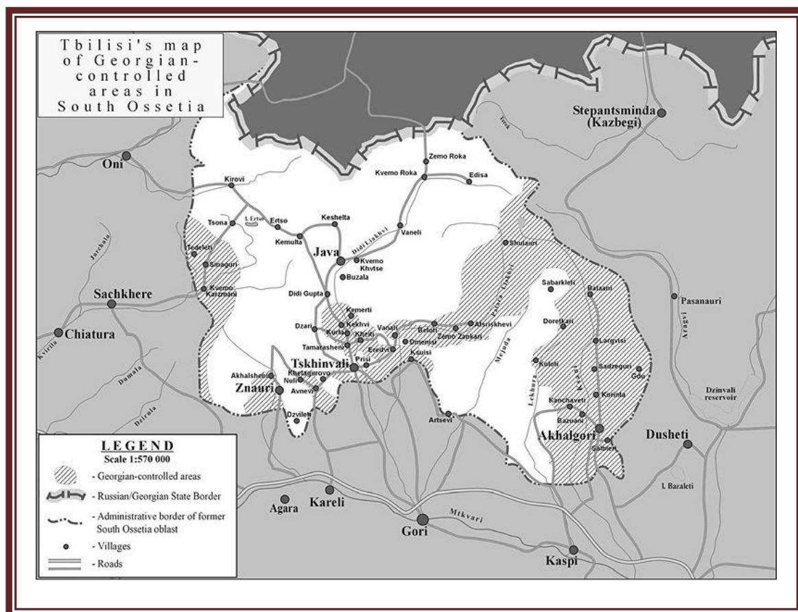
Рис. 4 Республика Южная Осетия (штриховкой показаны территории контролировавшиеся Грузией до 2008 года) [16]

Грузия не признаёт новый статус Южной Осетии, считая её частью собственной государственной территории: Цхинвальский регион («бывшая Юго-Осетинская автономная область»). В соответствии с современным административно-территориальным делением Грузии, территория Южной Осетии разделена между следующими административно-территориальными единицами Грузии: Шида-Картли, Мцхета-Мтианети, Имерети и Рача-Лечхуми и Квемо-Сванети.