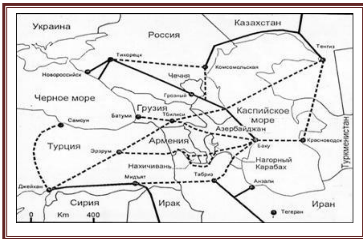
Рис. 7 Маршруты транспортировки каспийской нефти [5]

Итог конфликта: согласно Конституции Российской Федерации Чеченская республика образована в 1992 году, входит в её состав, являясь частью Северо-Кавказского федерального округа.