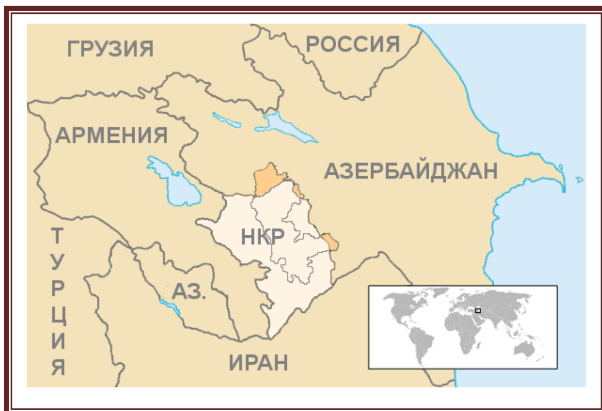
Рис. 2 Республика Арцах. Контуры территории, контролируемой Нагорно-Карабахской Республикой на момент подписания соглашения о прекращении огня 1994 г., наложены на контуры территории, на которой была провозглашена Нагорно-Карабахская Республика в сентябре 1991 г. [9].

Фактический итог: провозглашение независимости Нагорно-Карабахской Республики (Республики Арцах) в составе: НКАО, Лачинского (Кашатагского) района, «зоны безопасности» (Кельбаджарский, Кубатлинский, Джебраильский, Зангеланский районы и части Агдамского и Физулинского районов Азербайджана – 13% территории Азербайджана). При этом части Мартунинского и Мартакертского районов Нагорно-Карабахской Республики, контролируются Азербайджаном, да и такие районы традиционного проживания армян, как Шаумяновский и Ханларский по-прежнему остаются в составе Азербайджана (15% территории Нагорно-Карабахской Республики). Однако независимость Нагорного Карабаха признали только Абхазия, Южная Осетия, Приднестровская Молдавская Республика.