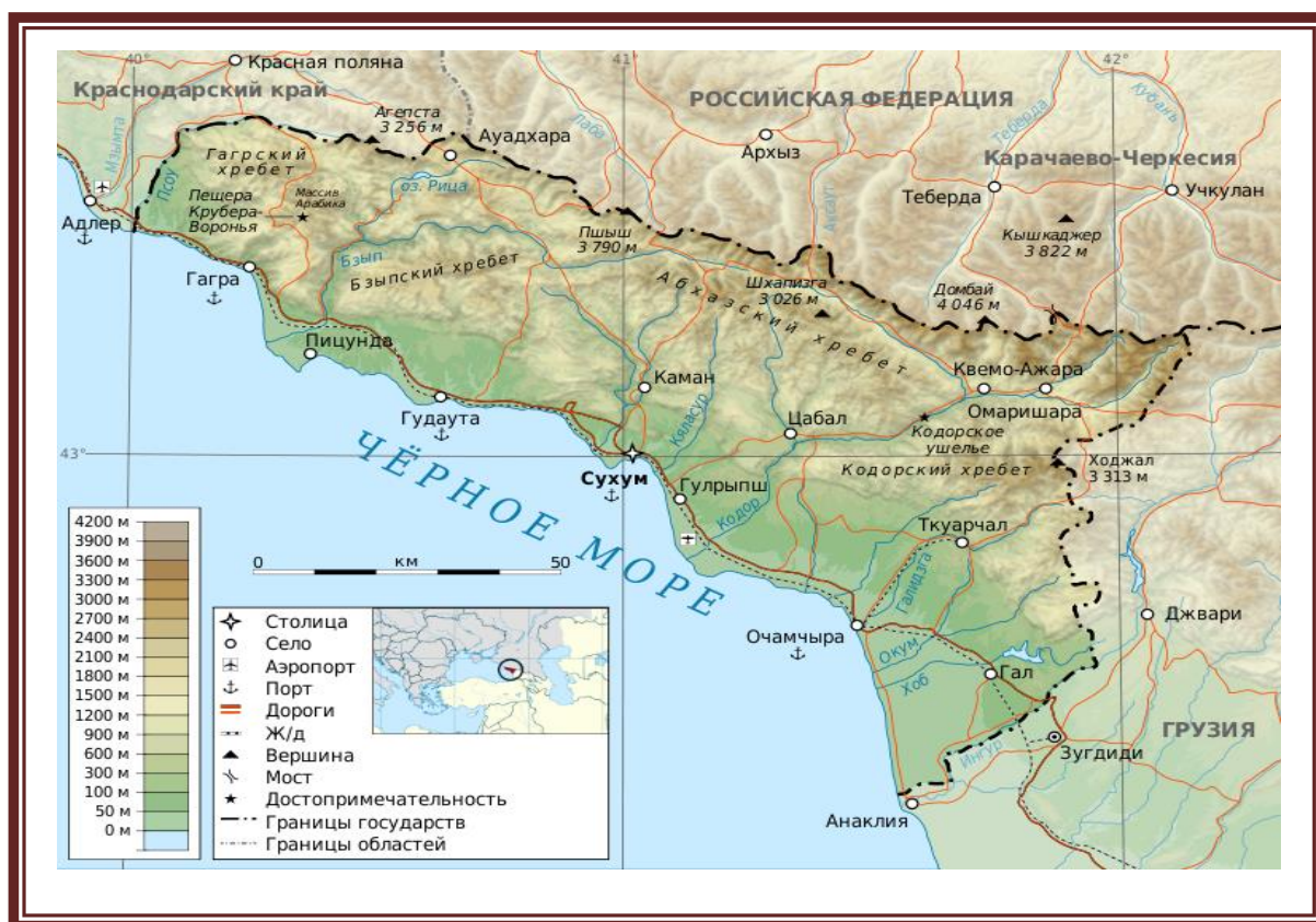
Рис. 3 Республика Абхазия [16]

В-третьих, нельзя не учитывать экономические факторы, влияющие на развитие конфликта: выход к Чёрному морю с соответствующей рекреационной и портовой инфраструктурой; транспортные магистрали (Транскавказская железнодорожная магистраль), связывающие Россию, Грузию, Армению. Именно необходимость охраны железной дороги послужила официальным поводом для вторжения войск Грузии на территорию Абхазии в 1992 году.